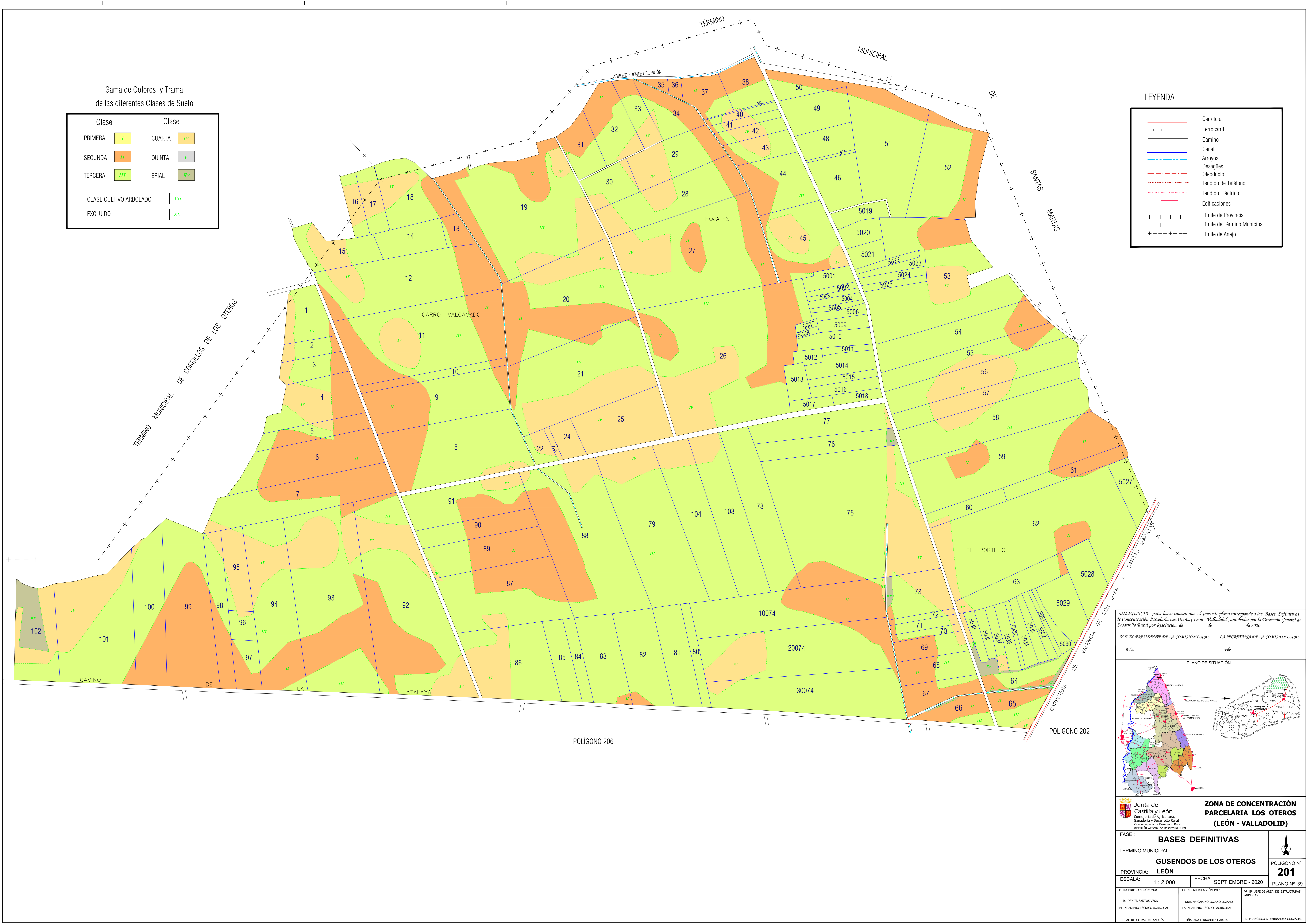
Gama de Colores y Trama de las diferentes Clases de Suelo